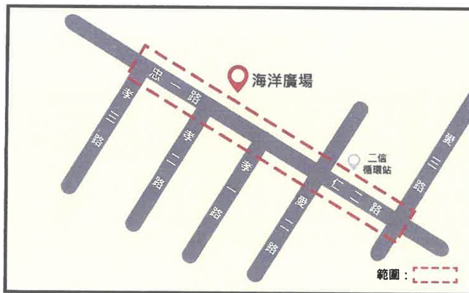
圖 3 海洋廣場管制範圍