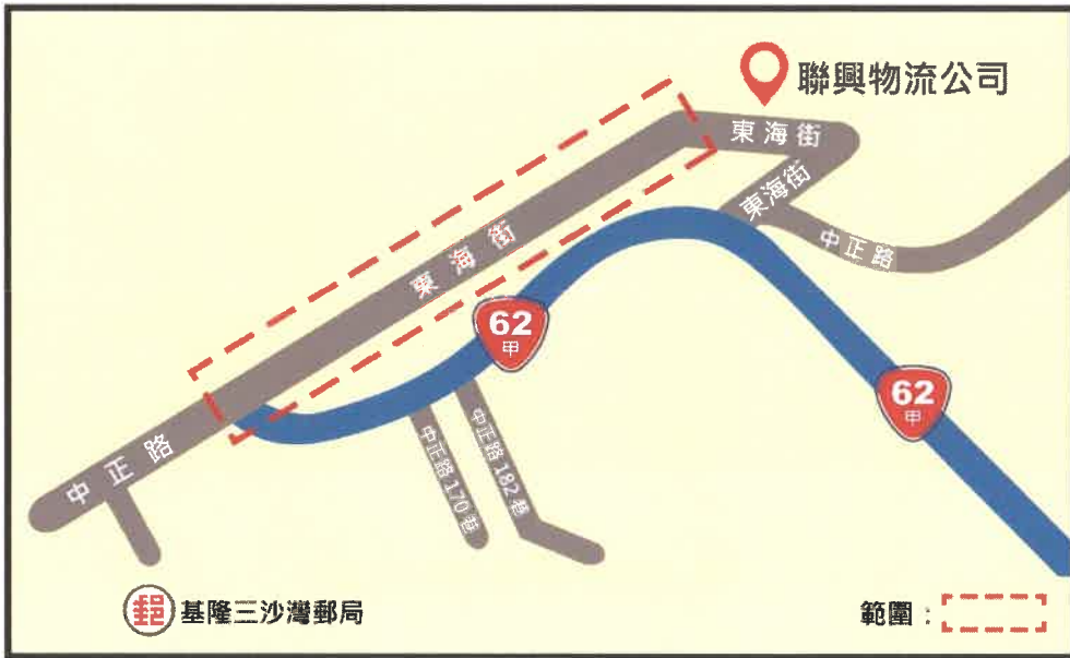
圖 1 港區東岸管制範圍